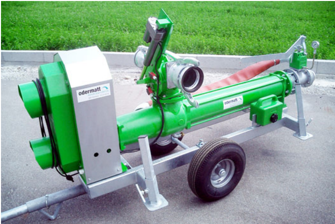
Funksteuerung mit Keilriemen-Kupplung