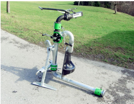
Kombi manuell oder elektrisch