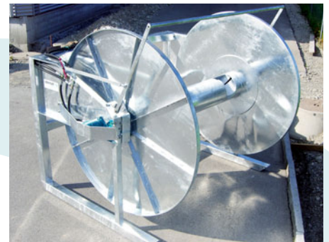
Oder nach Ihren Wünschen